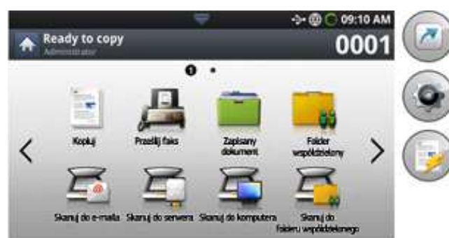
Kolorowy ekran dotykowy 7"

W celu uzyskania maksymalnej kontroli i widoczności model CLX-9251NA został wyposażony w kolorowy panel dotykowy o przekątnej ekranu 7", umożliwiający płynną obsługę urządzenia. Dzięki intuicyjnej obsłudze interfejsu użytkownika można szybko i łatwo zarządzać nawet najbardziej rozbudowanymi zadaniami drukowania.